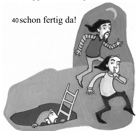
Aus: Kopisch, August: Die Heinzelmännchen zu Köln. Frankfurt: Insel Verlag 1989 (gekürzt)

10 ehe man's gedacht, 2 Die Zimmerleute streckten Zimmermann versah ... die Männlein sich hin auf die Spän' und Klapp, stand das ganze Haus ... und schwärmten | reckten sich. | 40 schon fertig da! und klappten und lärmten 25 Indessen kam und rupften die Geisterschar 15 und zupften und sah, was da zu zimmern war. |